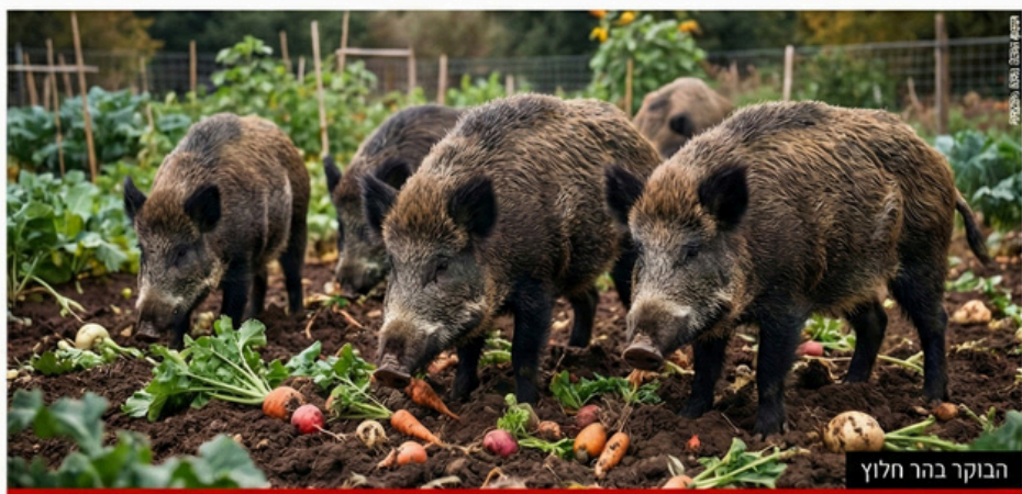
הבוקר בהר חלוצ